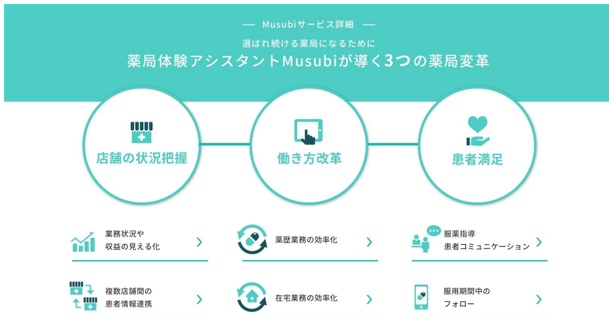
(図表) “薬局体験アシスタント”Musubiの提供価値イメージ